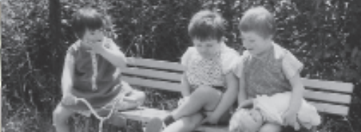
Kleine Pause 1958